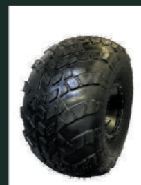
Шина сверхнизкого давления 1350 x 700-533 (2 слоя корда)