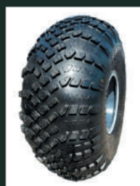
Шина сверхнизкого давления 1750 x 700-635 (4 слоя корда)