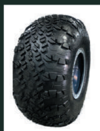
Шина серхнизкого давления 1650 x 700-635 (2/4 слоя корда)