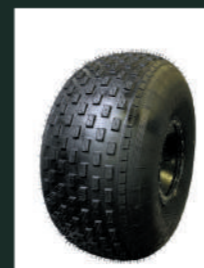
Шина сверхнизкого давления 1300 x 600-533 (2 слоя корда)