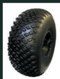
Шина серхнизкого давления 1600 x 700-635 (2/4 слоя корда)