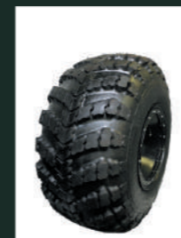
Шина сверхнизкого давления 1280 x 530-533 (2 слоя корда)