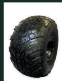
Шина сверхнизкого давления 1350 x 700-533 (2 слоя корда)