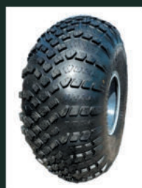
Шина сверхнизкого давления 1750 x 700-635 (4 слоя корда)