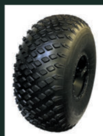
Шина серхнизкого давления 1600 x 700-635 (2/4 слоя корда)