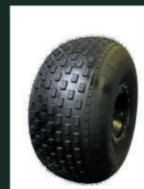
Шина сверхнизкого давления 1300 x 600-533 (2 слоя корда)