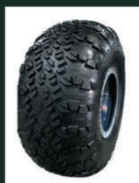
Шина серхнизкого давления 1650 x 700-635 (2/4 слоя корда)