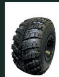
Шина сверхнизкого давления 1280 x 530-533 (2 слоя корда)